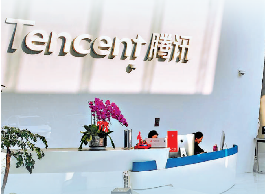
▲北水青睞騰訊持股總數10.02億股，價值6016億元，大大拋離其他港股。