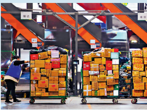
▲國家「反內捲」政策力度空前，快遞行業正從規模競爭轉向價值競爭。

【大公報訊】近期，在電商重鎮廣東、浙江兩地，多家快遞公司上調電商客戶快遞費用。除浙江義烏、廣東外，業內對福建、安徽、江蘇、山東等地也有漲價預期。業內分析人士表示，此次國家「反內捲」政策力度空前，短期看，單票均價將回升，推動企業利潤修復，末端派費的增加，將改善快遞員收入，提高穩定性；長期看，有望打破「以價換量」的循環，引導快遞行業從規模競爭轉向價值競爭。