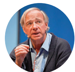
▲達里奧警告，美國可能在3年內陷入債務危機。

他指出，美國政府正在越來越多地干預私營機構的運作。例如，特朗普政府決定入股英特爾一成股份，這是極權領導風格的體現，旨