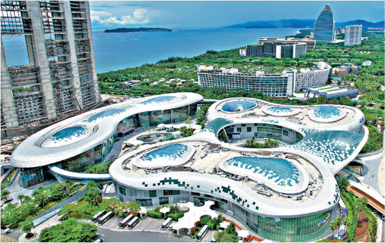
▲離島免稅作為海南自由貿易港政策制度體系的重要組成部分，是國際旅遊消費中心建設的重要抓手。圖為三亞國際免稅城。

去年12月17日，國家主席習近平在聽取海南省委和省政府工作匯報時發表重要講話，他指出：「努力把海南自由貿易港打造成为引領我國新時代對外開放的重要門戶，奮力譜寫中國式現代化海南篇章。同時，加強同粵港澳大灣區聯動發展。」