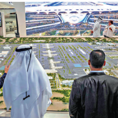
▲迪拜大舉貸款發展朱美拉棕櫚島等地標項目，曾背負高達逾6000億債務。

而經過這次的教訓後，迪拜進一步把經濟發展分散到更多非石油的業務，包括集中推廣旅遊業、貿易、科技，同時，亦更審慎地管理其債務。然而，迪拜卻始終擺脫不了繼續依賴房地產投資和過度融資的命運，勢將繼續成為中東金融市場的一大隱憂。