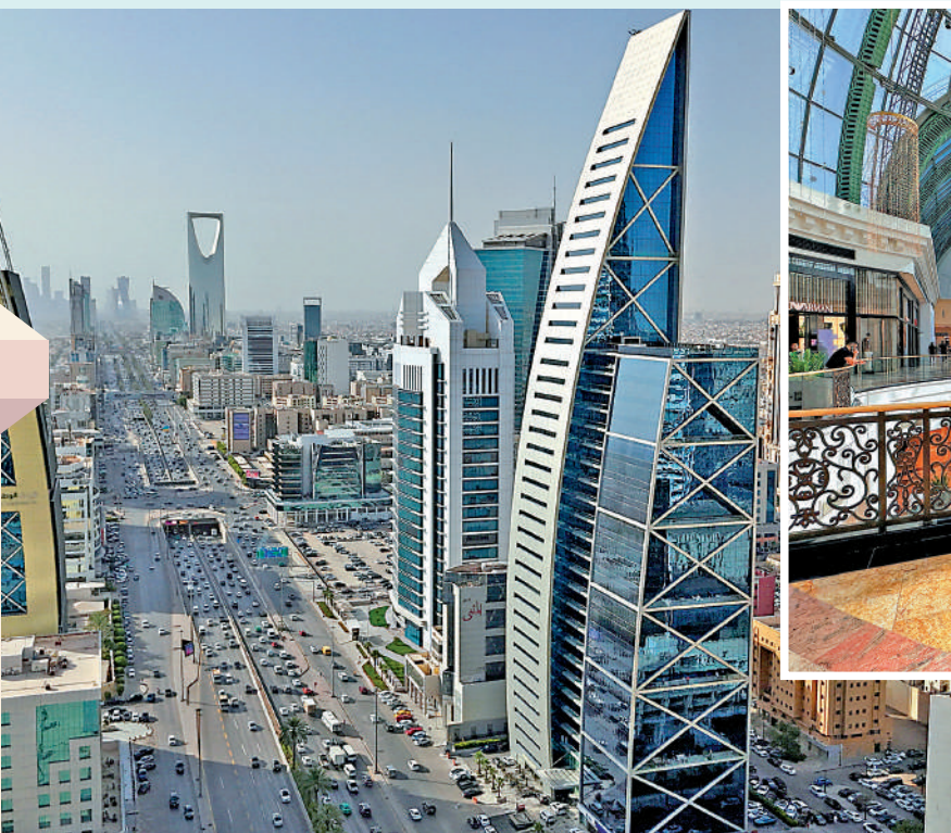
▲沙特推出《2030年願景》計劃，目標是減輕對石油經濟的依賴。