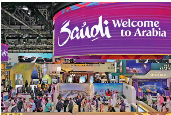
▲沙特《2030年願景》計劃的其中一個目標是發展旅遊業，促進經濟更多元化。

沙特推出《2030年願景》計劃的其中一個目的是發展旅遊業，以令經濟更多元化，收入亦可以增加以填補財赤擴大，而旅遊業的發展亦略見成效，根據聯合國世界旅遊組織的統計，2025年第一季度沙特的國際旅遊收入增幅位居全球第一，並且自2019年以來國際遊客人數大幅增長。單在2024年，沙特旅遊業直接和間接貢獻達4980億里亞爾（約1.03萬億港元），佔沙特GDP的12.45%，這亦解釋到為何IMF盛讚沙特發展非石油環節的努力成果。