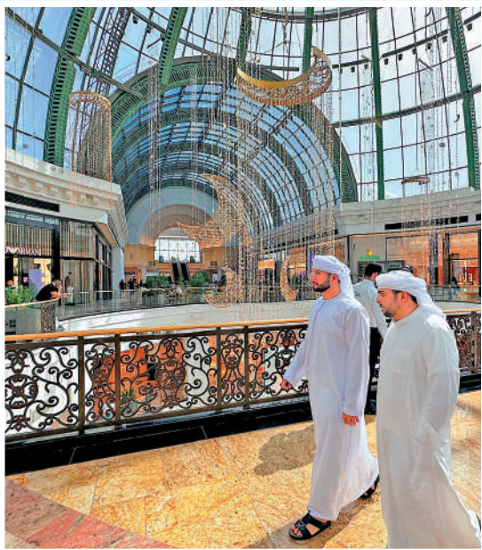
▲IMF肯定沙特在非石油經濟和強勁改革的成績，可抵禦國際局勢不明朗及原油收入持續下跌的影響。

沙特目前正處於債務緊張的周期，但相信其經濟基本面仍強勁，陷入債務危機的可能性較低。其實中東另一個發展迅速地區阿聯酋的迪拜在2009年曾爆發金融危機，最後因為阿布扎比伸出援手，才未至演變成一場大型的金融風暴。