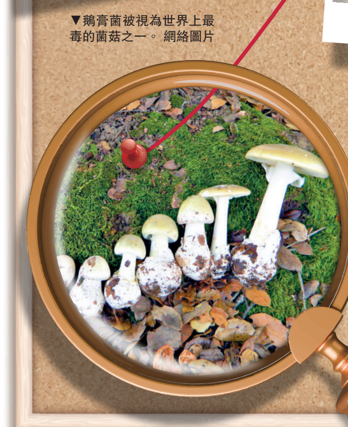
▼鵝膏菌被視為世界上最毒的菌菇之一。