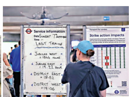
▲倫敦威斯敏斯特地鐵站，乘客在罷工前查看地鐵信息。