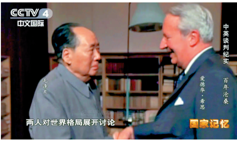
▲央視紀錄片《中英談判紀實》中介紹，1974年5月，毛澤東主席會見英國前首相保守黨領袖愛德華·希思，商談香港問題。

【大公報訊】記者王珏北京報道：1949年，新中國剛剛成立，解放軍威武之師南下一路解放國土，當部隊打到深圳界河邊，只要一號令下便可涉水渡河解放近在咫尺的香港，緣何止住了腳步？CCTV-4《國家記憶》欄目昨晚播出紀錄片《中英談判紀實》第一集《百年滄桑》，揭開當年「暫時不動香港」背後的戰略深意，毛澤東、周恩來等中共中央領導人以超越時代的戰略眼光，對香港採取了暫不收回，維持現狀，「長期打算，充分利用」的方針政策，使香港成為新中國突破西方封鎖的獨特窗口，並最終以和平方式洗刷百年國恥、迎來了東方明珠的完全回歸。