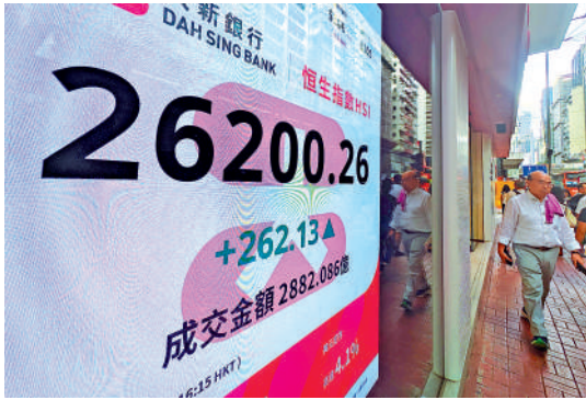
▲人工智能算力股昨日炒上，推升恒指創四年高位。

美國就業及經濟數據疲弱，市場關注美國聯儲局下周減息幅度或達到0.5厘，提振港股市場情緒。恒指昨日一躍重上26000點心理關口，最多飆高358點，收市升262點，收報26200點，連升四日，累漲1141點。主板成交額2882億元，較上日減少58億元，主要因南下資金縮量入市，港股通淨買入亦減少26.65億至75.66億元。