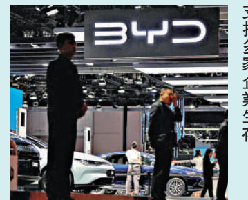
▲中信里昂認為，內地電動車市場規模巨大，足夠支持多家企業生存。

得這場賽事「入場券」；吉利汽車、零跑汽車正處於利潤率擴張期，產品周期非常強勁，在未來6至12個月值得關注。比亞迪可能要待明年首季才迎來催化劑。另外，小米（01810）、理想（02015）、賽力斯、小鵬汽車（09868）暫時領先。