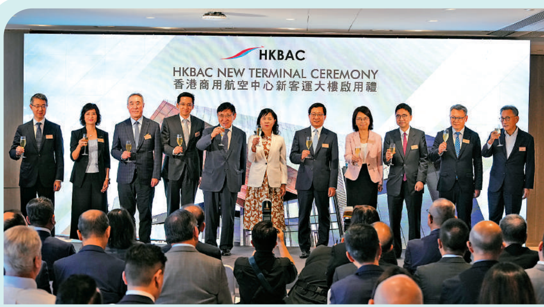
▲香港商用航空中心第一期現址擴建工程的新客運大樓竣工啟用，嘉賓舉杯慶祝。