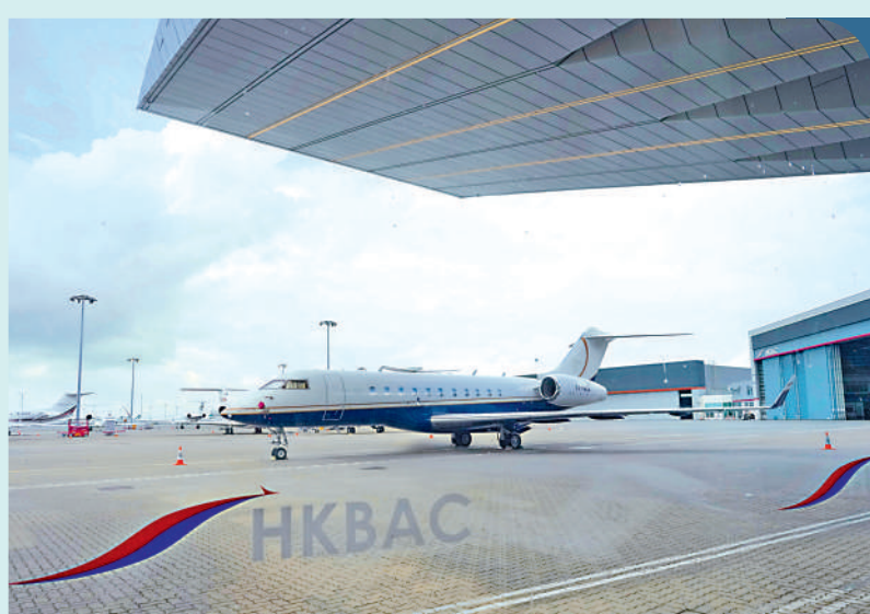
▲亞洲首創由客運大樓伸延至停機坪的天際簷篷，全長26米及金屬結構及無柱設計。