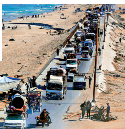
▶巴勒斯坦難民12日向南遷移，以躲避以色列的軍事行動。

【大公報訊】據新華社報道：當地時間9月11日，聯合國安理會召開緊急會議，討論以色列9日對卡塔爾首都多哈發動的襲擊。中國常駐聯合國代表傅聰在會上發言時，嚴厲譴責以色列襲擊卡塔爾。 傅聰說，以色列對卡塔爾首都多哈發動襲擊，公然侵犯卡塔爾領土主權和國家安全，公然違反國際法和《聯合國憲章》，公然破壞實現和平的努力。中方予以堅決反對和嚴厲譴責。傅聰重申，軍事手段和濫用武力不是解決問題的出路，立即停火才是拯救生命、讓被