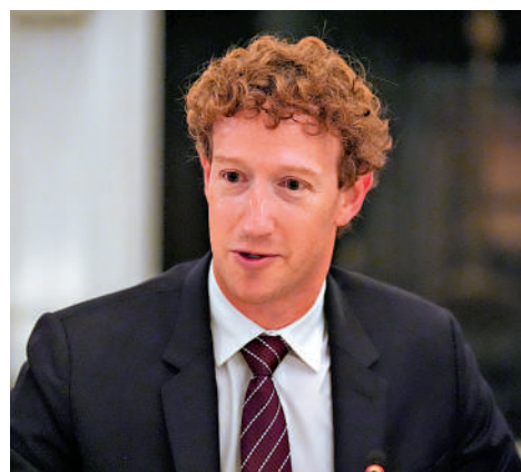
▲Meta創辦人朱克伯格。

美國聯邦貿易委員會(FTC)11日宣布，已向多家科技公司，包括Meta、谷歌母公司Alphabet、OpenAI、xAI等七家科技巨頭發出調查令，要求他們關注其人工智能(AI)聊天機器人可能對兒童和青少年造成的潛在危害，尤其是AI陪伴功能。隨着生成式AI的發展，越來越多的兒童及青少年把ChatGPT等AI聊天機器人當成陪伴對象，向其傾訴情緒，但也引發越來越多的情感倫理和隱私爭議。