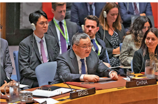
▲中國常駐聯合國代表傅聰(前中)11日在安理會中東局勢緊急公開會上發言。