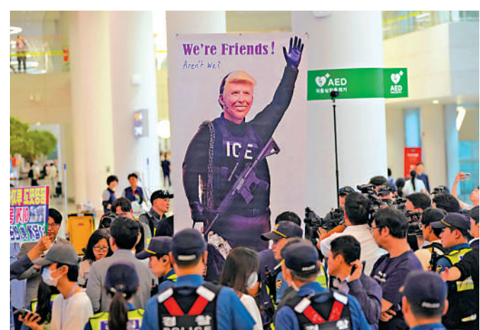
◀韓國民眾12日在仁川國際機場舉起反對美國總統特朗普的橫幅，不滿韓國工人被美方拘留。

另外，當地時間12日下午2時左右，被美國移民執法人員拘留的韓國現代汽車集團和LG新能源公司佐治亞州合資電池工廠的300多名工人，乘包機抵達韓國仁川國際機場。現代汽車行政總裁穆尼奧斯11日在底特律出席活動時表示，現代汽車在美國的電動車電池廠工程將至少「延工2至3個月」。