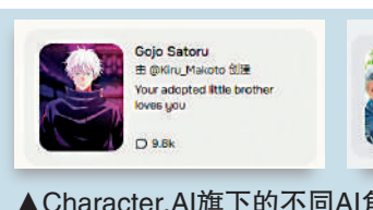
▲Character.AI旗下的不同AI角色。

AI的陪伴功能可能導致用戶對AI本身形成不健康的情感依賴，模糊了虛擬與真實的界限，用戶可能甚至把AI當作真實存在的人，影響現實中的人際交往。