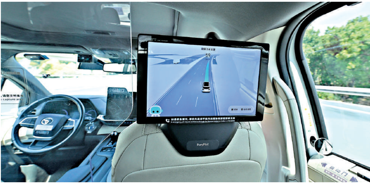
▲全球GPU市場目前由幾家國際巨頭所主導。因此，若中國要提升自動駕駛行業的自主可控能力，必須加速發展國產GPU。