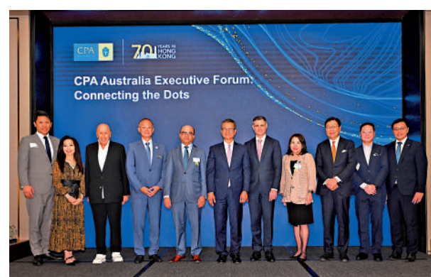
▲陳茂波（左六）昨出席澳洲會計師公會行政論壇時表示，投資者對香港重拾信心。

展望未來，他強調，香港正加倍重視創新科技，並與大灣區的姊妹城市攜手建構世界一流的創科生態系統，香港正積極吸引從事尖端科技的策略性企業。至今，已引進超過80家此類企業，計劃投資超過500億元，創造2萬個優質職位。新一批此類企業即將公布，其中包括幾家世界領先的製藥公司。