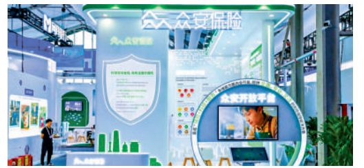
▲中國健康險AI解決方案有巨大市場潛力。

【大公報訊】中國健康險人工智能（AI）科技行業快速崛起。根據弗若斯特沙利文報告，該領域市場規模預計從2024年的231億元（人民幣，下同）增長至2029年的653億元，複合年增長率高達23.1%。儘管增長迅猛，2024年中國健康險AI解決方案的滲透率仍僅為11.9%，預計到2029年提升至15.6%，顯示有巨大市場潛力。