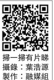
掃一掃有片睇 攝錄：葉浩源 製作：融媒組

海關指出，冒牌月餅的成分不明，有可能危害到消費者的健康，提醒消費者應光顧信譽良好的店舖，商戶在採購貨物方面亦應小心謹慎。海關已將部分冒牌月餅的樣本送往政府化驗所作檢驗。根據初步調查顯示，該批冒牌月餅將被轉運至海外地區。案件仍在調查當中，不排除有更多人被捕。