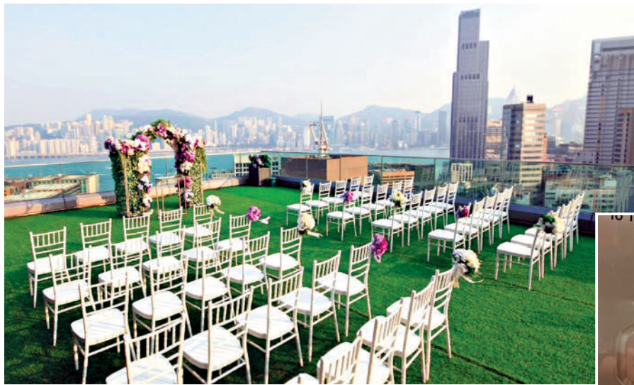
▲「星薈」主打婚宴，宣傳標榜「擁有270度景致露台作證婚場地或席前酒會」。

「星薈」了解，惟大廈電梯按鈕已無法前往20、21樓的樓層，最高只可以去19樓，致電「星薈」則長響無人接聽。有大廈保安表示，出入大廈的人士基本上是拍卡進入的員工，只有業主才能控制電梯可停留的樓層，不清楚酒樓突然結業的經過。