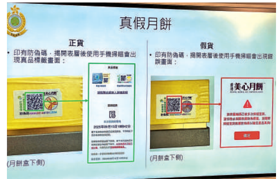
▲正貨月餅盒印有防偽碼，掃描後會出現真品標識畫面，冒牌貨則會出現錯誤畫面。

另外，自今年5月到目前為止，積金局收到34宗該公司僱員投訴，會將這些投訴個案與上述民事申索個案一併跟進。