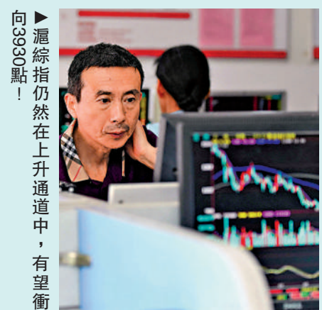
向3930點！ 滙綜指仍然在上升通道中，有望衝

TikTok能否談妥，已成為中美關係能否向前走的關鍵指標，並且對中美解決關稅問題意義重大。下一步，可留意中美最高領導人會不會通話，以及把領導人互訪提上議程。如果確認的話，中資股牛市很可能會延續至明年。