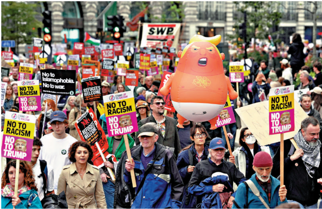
▲英國民眾17日在倫敦舉行反特朗普示威活動。