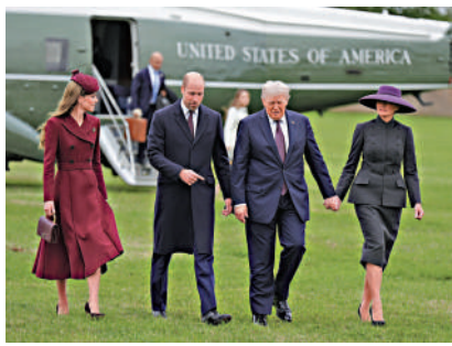
▲威廉王子（左二）和凱特王妃（左一）17日迎接特朗普夫婦。

首科爾賓17日催促英國外交大臣庫珀立即就聯合國指控以色列在加沙實施種族滅絕的調查報告發表聲明，而特朗普則派美國國務卿魯比奧訪以，重申美國堅定支持以色列。