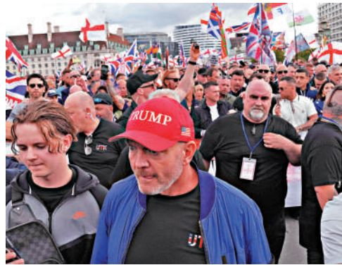
▲右翼人士13日戴着印有「特朗普」的帽子在倫敦參加反移民示威。