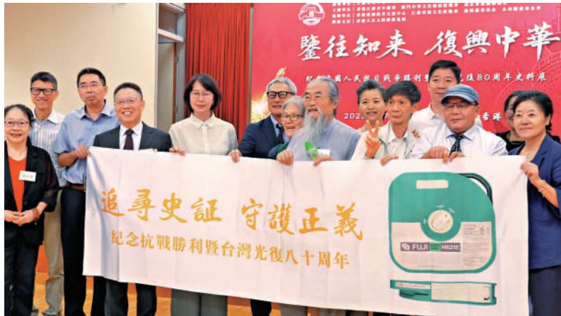
◀由大文集團牽線，1991年起在海內外參與追尋馬吉影像的部分歷史事件當事人齊聚香港。

月12日在大衛·馬吉家中找到13卷馬吉拍攝的南京大屠殺原始膠卷，這部紀錄南京大屠殺的唯一動態影像終於重見天日，成為世界記憶遺產不可或缺的重要组成部分。