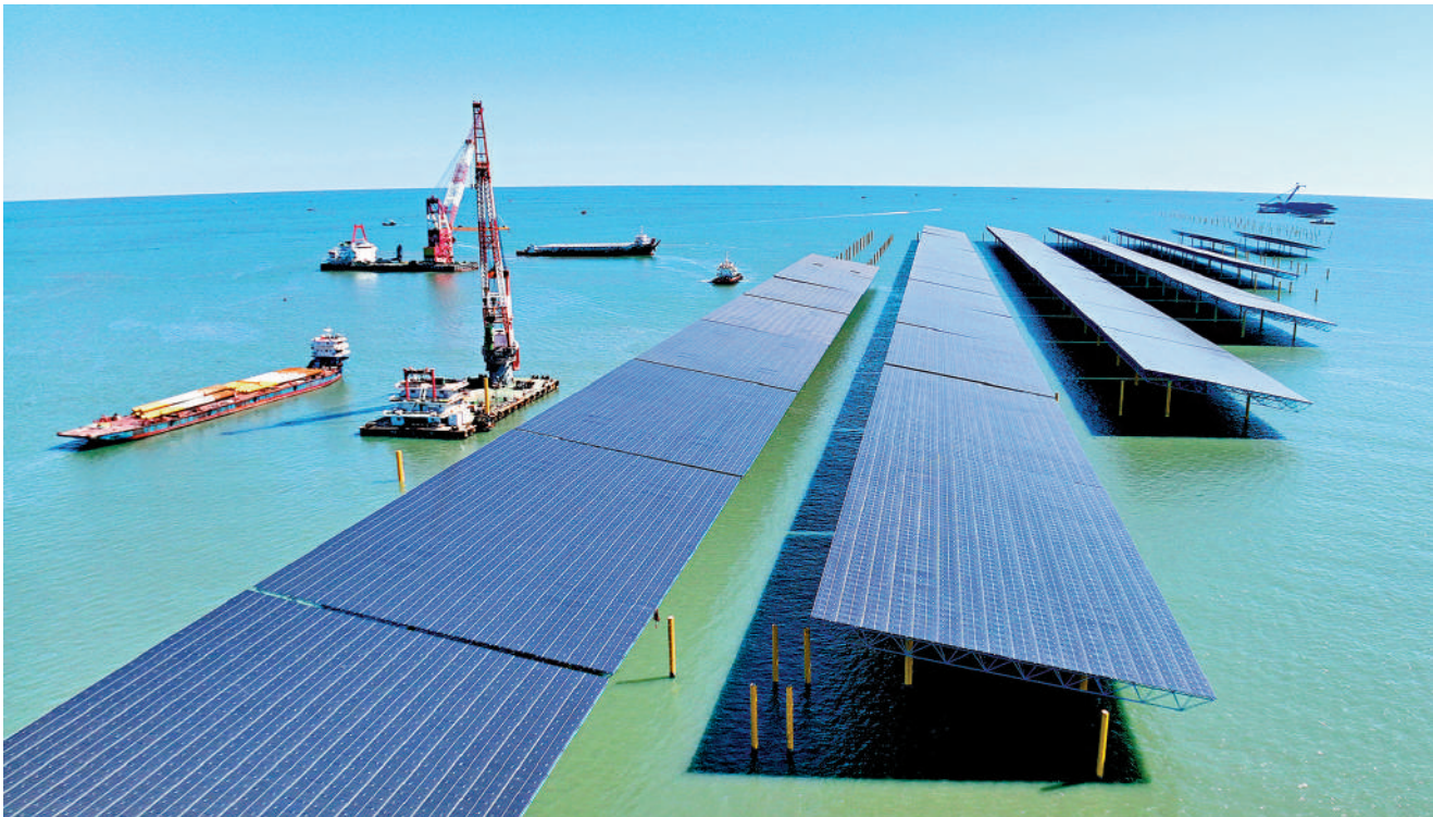
▲為實現國家「雙碳」目標，香港致力於2050年前達至碳中和。而綠色金融中心的地位，發揮環球資金窗口角色，鞏固香港國際

至於對其他細分領域的影響，香港綠色建築議會回應指出，期望節能減碳的實際成果可進一步轉化為具市場價值的碳信用，並鼓勵金融機構參與，為綠色建築項目提供額外資金支持。該會指出，此舉不僅促進綠色投資，更可鞏固香港作為國際綠色金融中心的地位。此外，該會已推出「綠色金融分類目錄合格中報服務」，協助銀行及業界確認項目是否符合香港金融管理局的綠色金融標準，並與香港綠色金融協會合作制定建造界在綠色金融分類目錄的操作指引，促進綠色融資。