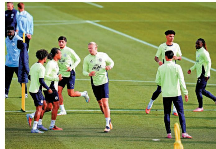
▲曼城球員在操練中。