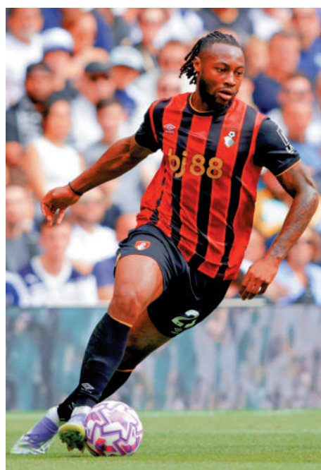
▲般尼茅夫翼鋒施曼尤。