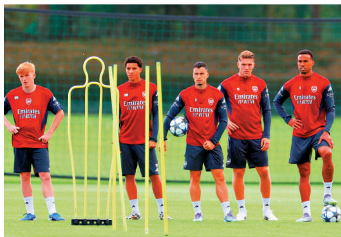
▲阿仙奴球員積極備戰。