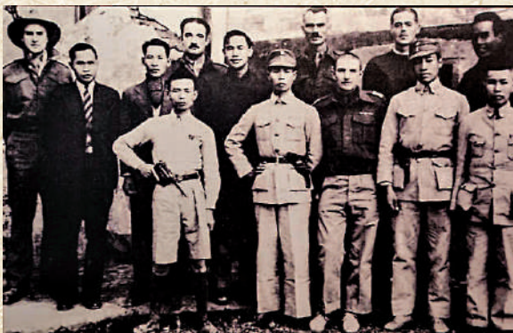
▲1943年12月，東江縱隊港九大隊與英軍服務團成員在營救美軍飛行員後合影。

檔案還顯示，東江縱隊與盟軍方面開展了情報合作，並得到華盛頓方面的高度讚揚。時任美軍第14航空隊司令陳納德在電報中稱：「若無東江縱隊