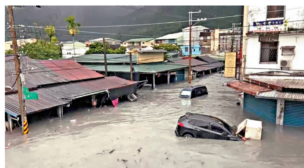
▲花蓮馬太鞍溪堰塞湖23日下午溢流致災，光復鄉淹水災情慘重，水深一度高達近1層樓，路上不少車輛泡水，多人受困，街道彷彿成了河道。