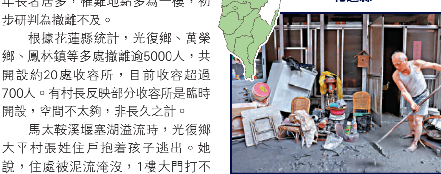
▲花蓮馬太鞍溪堰塞湖溢流，造成慘重災情。24日早上有民眾清理街道的泥濘。

賴當局上月剛說「沒危險」 馬太鞍溪堰塞湖溢流，造成光復鄉嚴重災情。國民黨立法機構團書記長羅智強24日說，他個人及黨團將分別捐出新台幣50萬元賑災。馬太鞍溪流域由民進黨當局主管，現在堰塞湖卻潰堤造成傷亡，行政機構應該痛定思痛檢討。