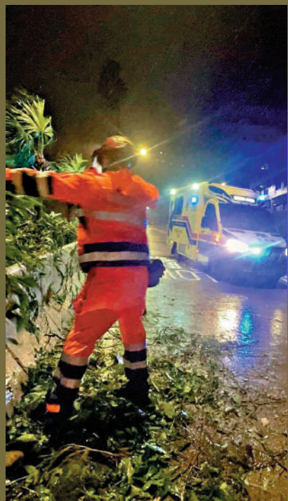
▲救護員移開塌樹，為救護車開路。

消防處在風雨下堅守崗位，竭力守護市民。有救護車出動期間，遇上塌樹擋路，人員立即上前將樹木移開，讓救護車能順利通過。