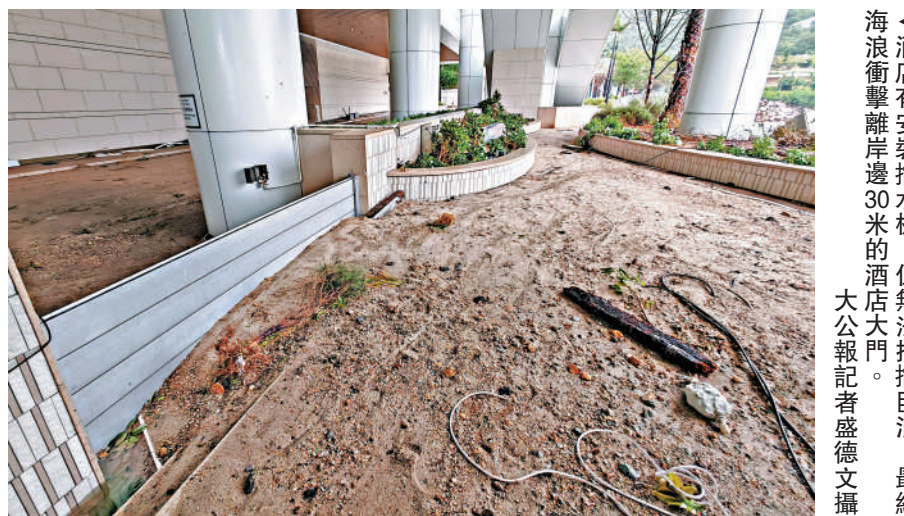
酒店有安裝擋水板，但無法抵擋巨浪，最終海浪衝擊離岸30米的酒店大門。