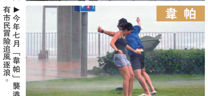
沙阻，有遊人的雨傘被吹翻。 有市民冒險追風逐浪。