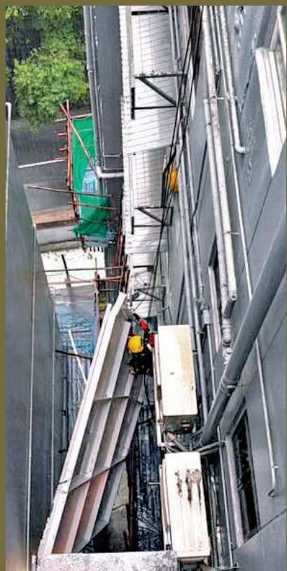
▲消防高空拯救專隊固定鬆脫的構築物。