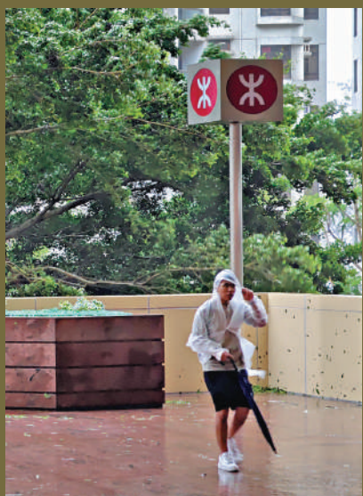
▲一名穿上雨衣的市民，踏着匆匆的步伐趕返自己的崗位。