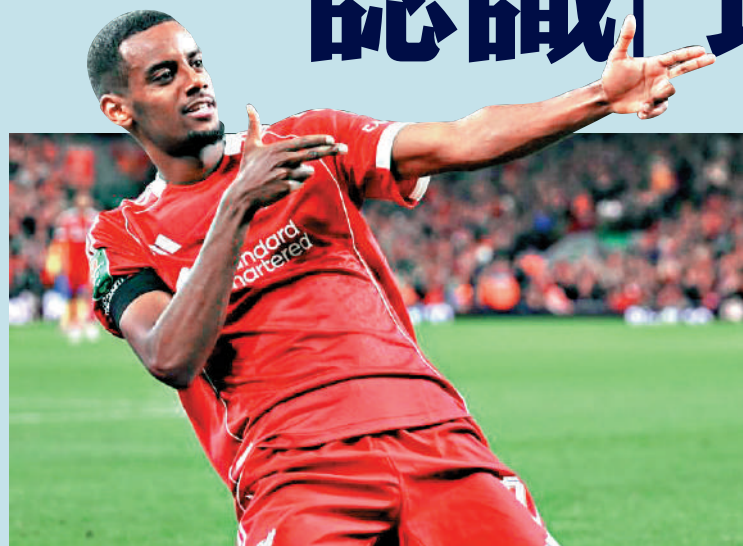
▲利物浦前鋒伊沙克。