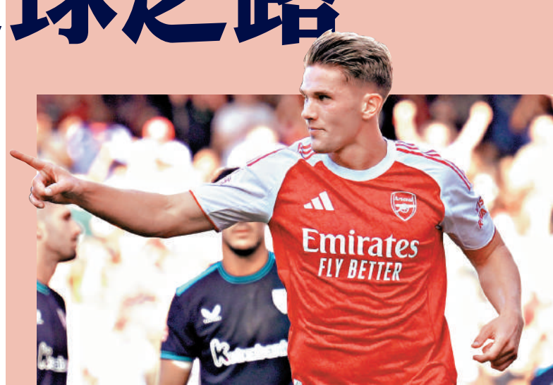
▲阿仙奴前鋒基奧基尼斯。