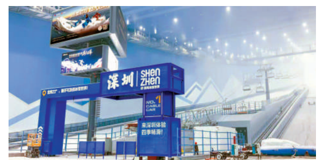
◀華發冰雪熱雪奇跡硬件設施齊全完備，為滑雪發燒友配備5條專業滑道，設置2處地形公園。