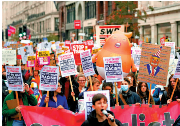
▲示威者13日在倫敦舉行的反移民抗議活動中與警方發生衝突。 ▲示威者17日參加「阻止特朗普聯盟」在倫敦舉行的活動，反對特朗普對英國進行國事訪問。