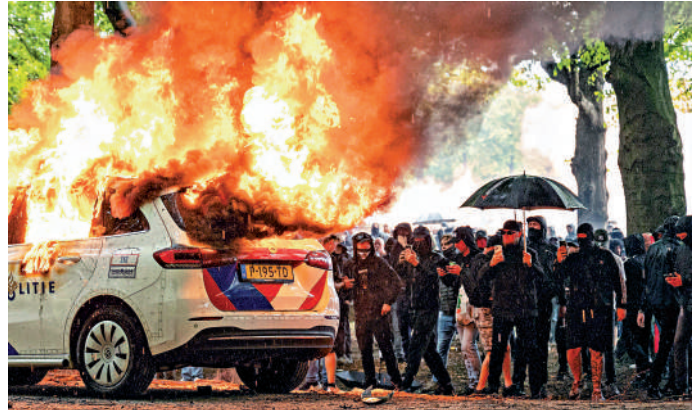
▲荷蘭海牙20日爆發大規模反移民示威，一輛警車被焚燒。

事實上，德國執政聯盟的內部分歧早在此前就有跡象。5月6日，德國聯邦議院舉行總理選舉投票。而作為聯盟黨總理候選人的默茨歷經兩輪投票才成功當選總理。分析認為，默茨未能在首輪投票中勝出，正反映出聯盟黨和社民黨組成的執政聯盟內部存在明顯分歧，執政聯盟的施政前景本就不樂觀。另外，遭到德國政壇排斥的極右翼德國選擇黨已成為主要反對黨，為本就存在分歧的政治格局再添不確定性。歐洲其他國家同樣面臨政治分裂的問題，西班牙首相桑切斯領導的執政聯盟不得不與加泰羅尼亞的分離主義政黨結盟，以確保對國會的控制權；荷蘭首相斯霍夫挺過了8月的不信任投