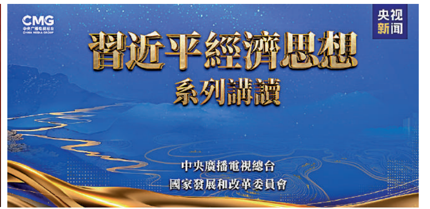
▲由中央廣播電視總台製作的專題片《習近平的文化情緣》和大型專題節目《習近平經濟思想系列講讀》，9月29日起將陸續在香港多家主流媒体播出。

特邀我國經濟領域專家學者進行解讀，以通俗易懂的電視語言將理論宣講、解疑釋惑同研機析理有機結合，展現習近平主席對新時代我國經濟建設重大理論和實踐問題的深邃思考和科學判斷，