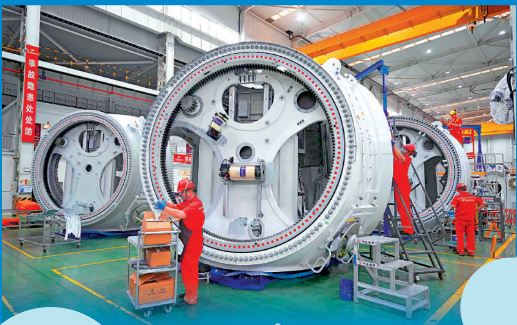
▲綠色能源轉型，中國穩步推進，風能日益壯大。江蘇省鹽城市地處黃海之濱，沿海風能資源豐富，在金風科技於鹽城大豐基地的總裝車間，工人在生產風電機組電機。

然而，美國總統特朗普日前在聯合國大會一般性辯論上，竟將矛頭對準中國，在全無事實根據的情況下，宣稱中國製造很多風力發電設備，但卻「幾乎不使用風力發電」。美媒分析，特朗普敵視風力發電政策取向，將導致美國海上風電備項目銳減。預計到2035年，美國海上風電裝機容量較特朗普當選前下降56%，意味着美國在綠色低碳轉型賽道上被中國遠遠拋離。