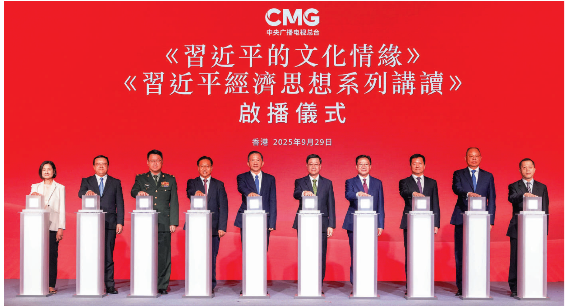
▲由中央廣播電視總台製作的專題片《習近平的文化情緣》和大型專題節目《習近平經濟思想系列講讀》啟播儀式，9月29日在香港舉行。

香港特別行政區行政長官李家超，中宣部副部長、中央廣播電視總台台長慎海雄，中央人民政府駐香港特別行政區聯絡辦公室主任周霽在活動上致辭，並與外交部駐香港特派員公署特派員崔建春，中央人民政府駐香港特別行政區維護國家安全公署副署長陳楓，解放軍駐香港部隊副政治委員王兆兵，中央廣播電視總台編務會議成員薛繼軍等共同為節目啟播。香港特區立法會主席梁君彥，全國人大常委會委員李慧琼，全國政協常委、香港旅遊發展局主席林建岳等出席。 李家超對中央廣播電視總台長期以來致力於推動中華文化傳承、講好中國故事、支持「一國兩制」實踐表示感謝。他說，總台此次推出的《習近平的文化情緣》深情講述了習近平主席對中華文明根脈的守護與深情。一個個溫暖故事串聯起五千年文化的壯麗圖景，這不僅是對文化的致敬，更是對民族精神的喚醒。在香港這座中西交匯的國際都市，弘揚中華文化，增強家國認同，正當其時、意義重大。《習近平經濟思想系列講讀》是新