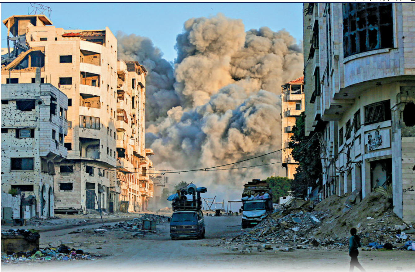
以色列持續轟炸加沙城高層建築。