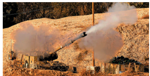
以色列軍隊向加沙地帶發射炮彈。

地位不穩定，需要依靠極右翼黨派的支持。然而，以色列極右翼財政部長莫特利奇形容該計劃是「徹底的外交失敗，將以悲劇收場」。他批評該計劃「將我們的安全交給外國人」，並「浪費了徹底扼殺巴勒斯坦建國野心的機會」。他又稱：「難道我們別無選擇嗎？這難道是目前所能達到的最大限度嗎？」