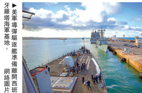
美國海軍艦隊在羅塔海軍基地。

這一舉措「深感擔憂」，並指責西班牙作為北約成員國卻限制美國的軍事行動，「助長了恐怖分子的氣焰」。