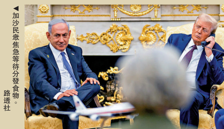
特朗普和內塔尼亞胡（左）會晤期間，與卡塔爾首相兼外交大臣穆罕默德通電話。

【大公報訊】根據白宮當天發布的文件，「20點計劃」的核心是通過停火交換被扣押人員、以色列逐步撤軍，實施國際監督，實現加沙地帶的去軍事化和重建。其要點包括：哈馬斯在以色列公開接受這一計劃的72小時內釋放所有被扣押人員；建立臨時治理機構，在巴勒斯坦民族權力機構完成改革前由技術專家委員會過渡管理，並接受國際社會參與的「和平理事會」監督；哈馬斯及其派別不得以任何形式參與加沙治理；以色列分階段撤軍，不會佔領或吞併加沙等。