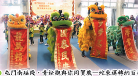
● 屯門南延綫，青松觀與你同賀歲—蛇來運轉納百福