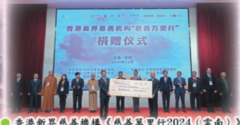
● 香港新界慈善機構「慈善萬里行2024 (雲南)」一捐贈善款支票儀式