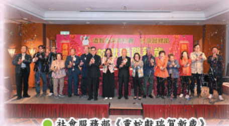
● 社會服務部 (靈蛇獻瑞賀新歲)

青松觀為香港註冊非牟利慈善團體，創觀至今歷七十餘年，一直以慈善事業為壇務推展的重點，除宗教宣道外，更因應香港社會情況之需要，先後設立安老、教學及醫療等慈善事業：