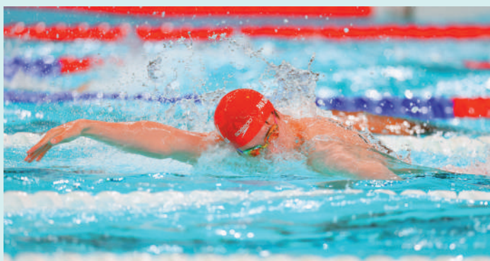
▲潘展樂是男子100米自由泳世界紀錄保持者。

會，在100米和200米自由泳兩個單項以及4×100米自由泳、4×200米自由泳、4×100米混合泳等3個接力項目上，均具備奪冠實力，有望成為全運會游泳項目的「多金王」。除了取得金牌外，潘展樂在100米自由泳項目上能否再次游進46秒5以內或者打破自己保持的世界紀錄，也是全運會游泳比賽的一大看點。