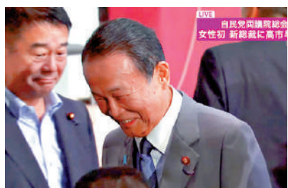
▲麻生太郎在高市勝選後露出笑容。視頻截圖