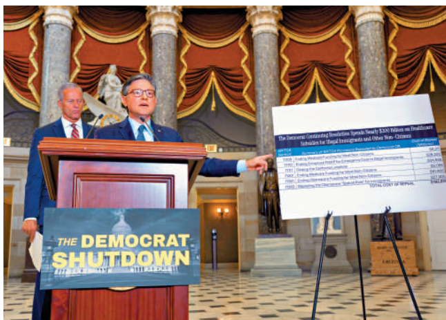
▲美眾議院議長約翰遜（前）3日在國會見記者。

民主黨人希望延長即將於今年年底到期的「奧巴馬醫保」加強型補貼，並撤銷國會此前在「大而美」法案中通過的對聯邦醫療補助的削減。共和黨人尋求的臨時撥款方案旨在按現有水平維持政府運轉至11月21日。共和黨人稱，只有