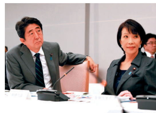
▲2014年，時任日本首相安倍晉三（左）與時任總務大臣高市早苗出席會議。

辭職下台的現任首相石破茂。她在外交安保方面保守強硬，主張提高防衛費、修改日本戰後和平憲法、實施嚴格的「外國人政策」等。