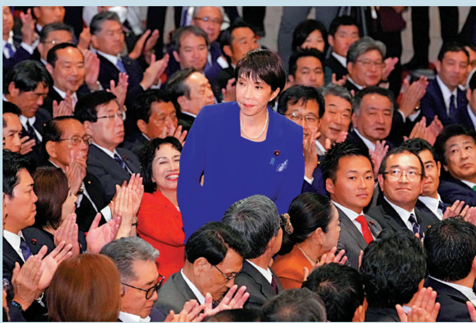
▲高市早苗（中）4日勝出自民黨總裁選舉後，起身致意。

日本自民黨4日舉行總裁選舉，前經濟安全保障擔當大臣高市早苗最終勝出，成為自民黨首位女總裁，並有望在10月15日國會首相指名選舉中當選日本首位女首相。分析人士認為，高市作為日本右翼政客代表人物此次能勝選，體現了自民黨和日本社會進一步右傾化。她上台後將面臨「朝小野大」、國內民生、外交關係等多重挑戰，執政之路恐不會平坦。