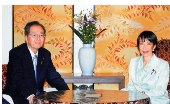
高市早苗(右)7日與公明黨黨首齊藤鐵夫舉行聯合執政磋商。

還有記者指出，小泉在第一輪投票獲得的議員票數少於預期，讓他受到打擊，決選前演說表現不佳。