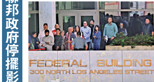
聯邦僱員在政府停擺期間領不到工資。

● 靠美國政府發工資的200多萬僱員在政府停擺期間領不到工資。其中約75萬人無薪休假，必要崗位人員繼續上班，但工資停發。美軍各軍種合計約130萬現役軍人也會停薪。