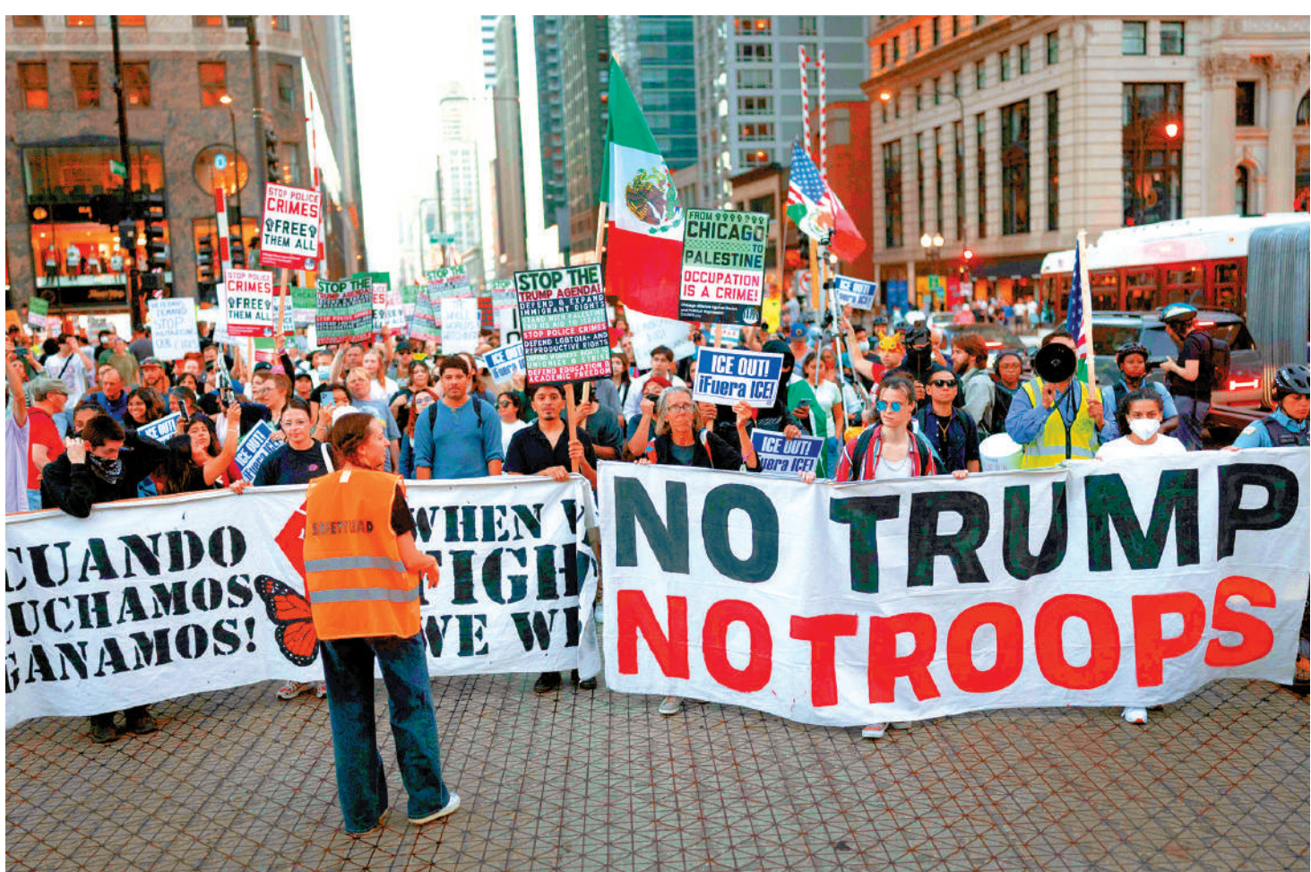
美國民眾9月30日在芝加哥示威，抗議特朗普政府的各項政策。

【大公報訊】由於預算談不攏，美國聯邦政府從10月1日開始停擺。10月7日，特朗普回答媒體記者提問時說，聯邦政府重新開門之後，因政府停擺被迫無薪休假的聯邦僱員可能無法獲得補發工資。他聲稱，是否補發工資「取決於我們談論的是誰……有些人真的不值得照顧，我們會用不同的方式照顧他們」。