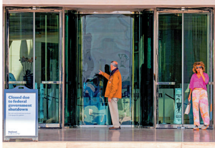
美國國家美術館因政府停擺而關閉，兩名遊客6日失望而歸。

若停擺持續，人事管理局為聯邦僱員辦理退休手續、新航線審批、藥品審批等服務也將受到影響。