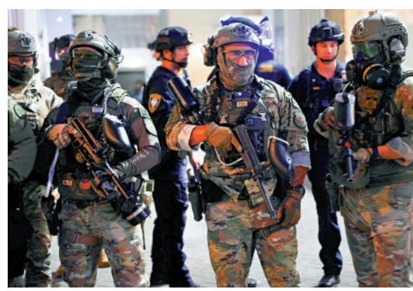
聯邦執法人員6日守衛在波特蘭市的移民設施附近。

特朗普還動用軍隊參與執法，將國民警衛隊派往加州洛杉磯、美國首都華盛頓、伊利諾伊州芝加哥等民主黨主政地區，引發法律大戰。7日，首批200名得州國民警衛隊員抵達芝加哥，未來幾天還將有300名伊利諾伊州國民警衛隊員進駐該市。伊利諾伊州和芝加哥市已於6日對特朗普政府提起訴訟，試圖阻止其向芝加哥派兵。