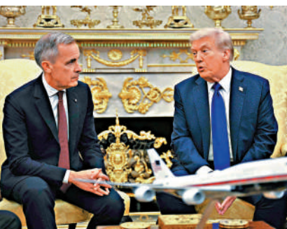
特朗普(右)7日在白宮與卡尼舉行會晤。

特朗普在回答記者提問時說，希望在美國市場上使用本國產品，美國人不想買加拿大製造的汽車和鋼鋁，並明確表示與加拿大達成完全免關稅