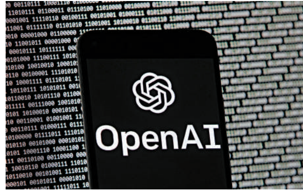
▲AMD將自家芯片證券化，變相為OpenAI提供了融資支持。