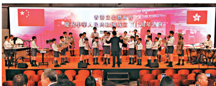
酒會開場前邀請了全港小學組高級管樂團校際比賽全港總冠軍——英華小學管樂團帶來精彩演奏。