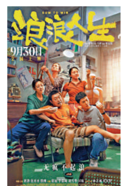
▲《浪浪人生》幽默與溫情兼備。