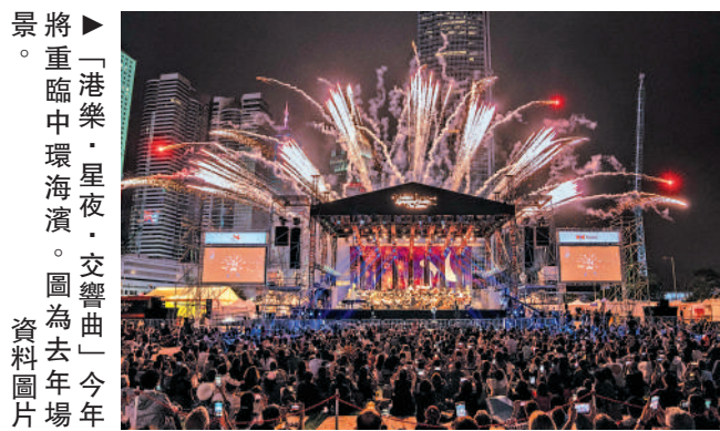
「港樂·星夜·交響曲」今年將重臨中環海濱。圖為去年場景。資料圖片