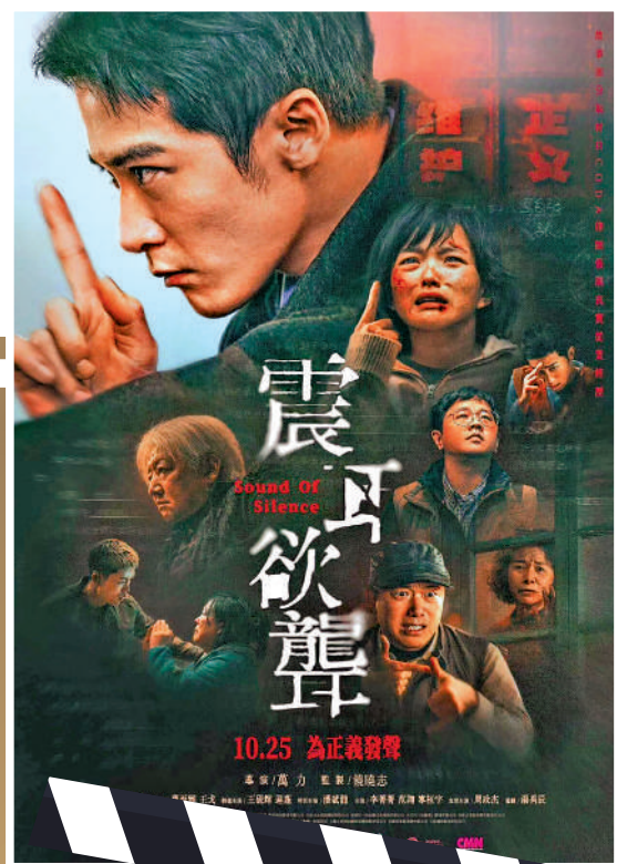
▲《震耳欲聾》將於10月25日起在香港上映。