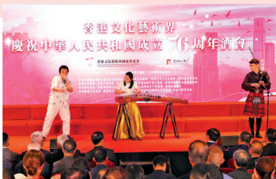
三位青年藝術家獻上跨界演出，巧妙融合古箏、Beatbox及蘇格蘭風笛，展現傳統與現代的藝術對話。

香港文化藝術界國慶籌委會同日舉行「區區有戲睇」開幕儀式，並安排了紀錄片《里斯本丸沉沒》作為開幕電影，該電影透過感人至深的歷史故事，弘揚人性光輝，傳遞和平可貴的訊息。