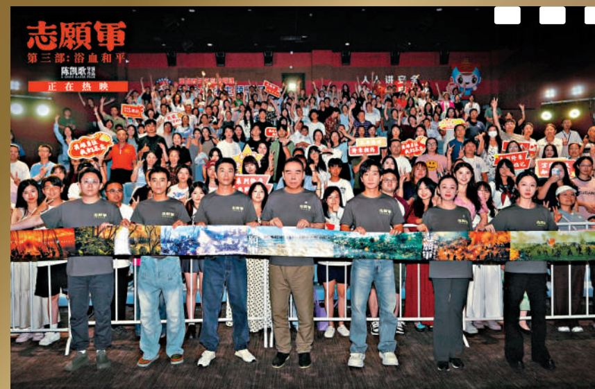
▲《志願軍：浴血和平》劇組國慶期間在南昌路演現場。

截至10月8日，全年電影總票房已達437.89億元，同比增長18.98%，比2024年全年總票房超出12.87億元；觀影人次10.35億，同比增長19.39%，比2024年全年總人次超出2528萬。