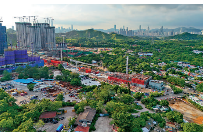
▲北都將會是香港未來房屋供應的主要來源，預計可提供約50萬個新住宅單位。圖為古洞站發展範圍。

的青少年都有廣闊空間盡展所長。在託兒服務方面，政府會根據以人口為基礎的規劃比率，為每25000人口預留空間提供100個資助幼兒中心服務名額，以配合北都新發展區人口遷入所帶來的服務需求。在青少年支援方面，政府亦會為每12000名屬於6至24歲年齡組別的兒童/青年規