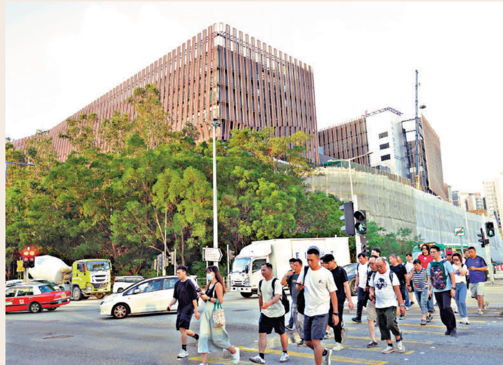
▶位於將軍澳百勝角路的中醫醫院將於12月11日分階段啟用，首年提供門診和日間住院服務。

醫務衛生局局長盧龍茂昨日表示，期望醫院進一步建立純中醫、中醫為主及中西醫協作臨床服務的香港模式，為市民提供更全面的中醫藥服務。