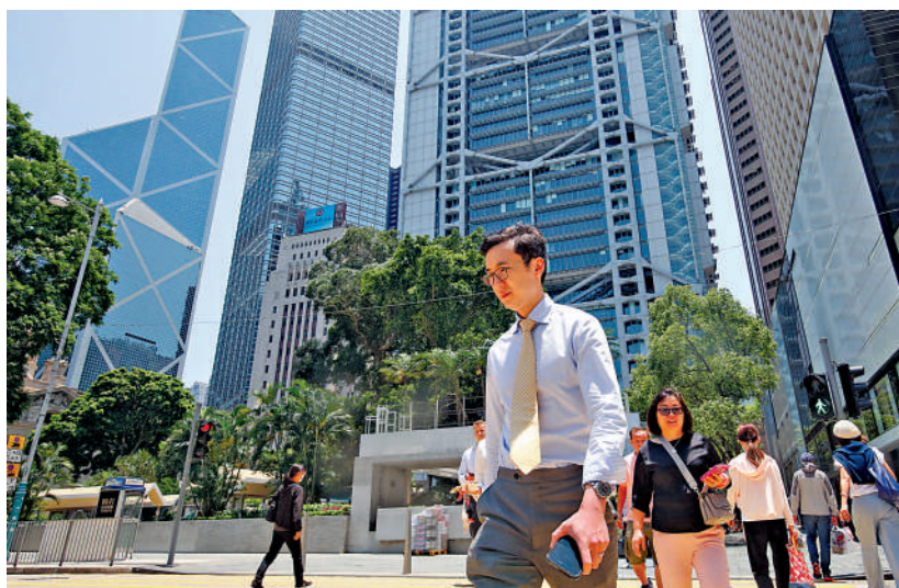
▲根據瑞士洛桑國際管理發展學院發布的《2025年世界競爭力年報》，香港的全球競爭力位列全球第三。

Last month, the U.S. Department of State released its 2025 Investment Climate Statements. In a clear disregard for the growing presence of U.S. companies in Hong Kong — and driven by its own political agenda — the Department once again issued a biased assertion regarding Hong Kong's business environment, failing to uphold its mandate to support U.S. businesses. Unsurprisingly, a survey of U.S. companies operating in Hong Kong highlights their call for deeper understanding of the region by the U.S. Government.