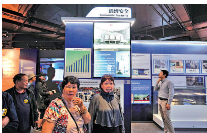
▲香港國安法和《維護國家安全條例》實施以來，香港繁榮穩定得到更好保障。

根據各項調查，在港外商普遍對香港的法治抱有高度信心。例如，香港美國商會在今年初發表的年度會員調查顯示，有83%在港美企對香港法治有信心，比2024年及2023年分別增加4個及10個百分點；70%的企業指它們的運作沒有受到國安法的影響。