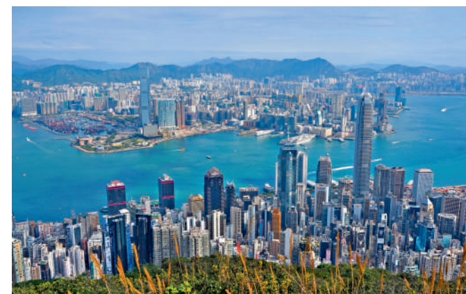
▲香港美國商會今年初發表年度會員調查，顯示83%在港美企對香港法治有信心。

撰寫「報告」相關內容的美國駐港總領館繼續老調重彈，以惡意評價香港營商環境，無非自暴其短，也辜負了其服務美國在港企業的使命。在香港美國商會的年度會員調查中，美國企業表示，希望美國政府能多了解香港的法律制度，派出更多官方代表親身到香港看一看。