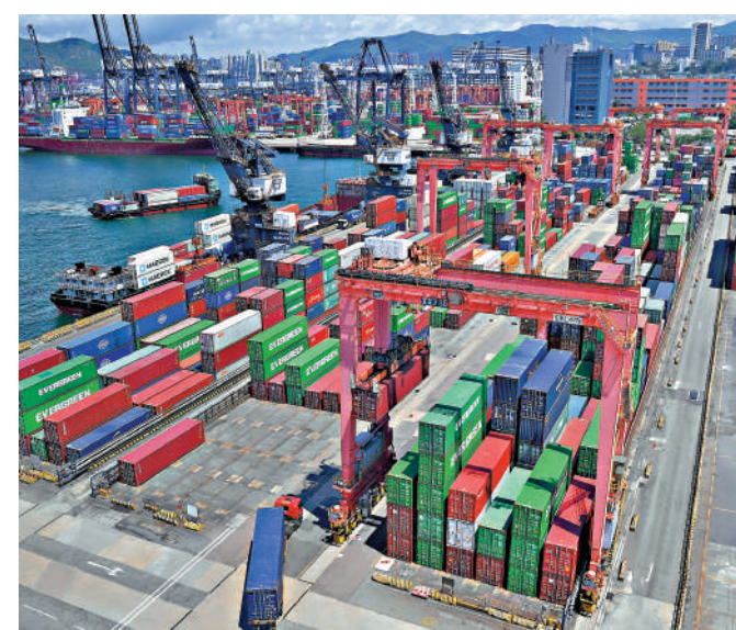
▲香港在「一國兩制」下，將一如既往堅定保持自由港的地位、實行自由貿易、簡單低稅制等政策。

對於網絡不當內容，許多國家和地區早已採取應對措施。例如歐盟及歐盟成員國法規要求大型網上服務供應商須在收到個別使用者通知或國家機構告知後，迅速移除非法內容，包括有害兒童青少年資訊、不實資訊、仇恨言論、強迫推銷等網絡內容；英國規定科企在預防和迅速刪除恐怖主義等非法內容方面應承擔法律責任；澳洲可強制刪除有關兒童性剝削和極端主義等非法網絡內容等等。美國政府最近也被揭露曾要求社交媒體刪除有關新冠病毒和疫苗的不實資訊。