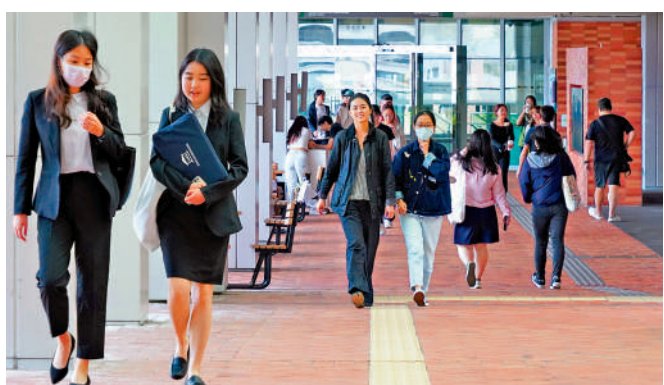
▲香港蟬聯全球最自由經濟體榜首，世界人才排名躍居全球第四。

香港國安法和《維護國家安全條例》實施以來，香港繁榮穩定得到更好保障，香港由治及興的基礎愈加牢固。如今，香港蟬聯全球最自由經濟體榜首，國際金融中心地位和世界競爭力均列全球三甲，外來直接投資流入金額居全球第三，世界人才排名躍居全球第四。截至去年，有近10000家母公司在海外及中國內地的企業選擇香港作為基地，創歷史新高。其中母公司在美國的公司近1400家，同比上升9%。