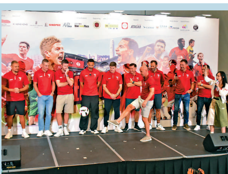
▲畢特（前）試射九宮格，卻將皮球踢出會場外。