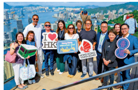
▲里奧費迪南（左三）上月來港時曾到訪太平山頂。

情，更重要的是透過里奧費迪南等國際體育明星的親身體驗與正面評價，向全球展現了香港的都市魅力與舉辦大型活動的卓越能力。運動員在港的真實感受與積極分享，成為宣傳香港的最佳代言，有力印證了香港在國際體育盛事領域日益提升的地位，也為持續吸引高消費旅客、鞏固「盛事之都」美譽奠定了堅實基礎。