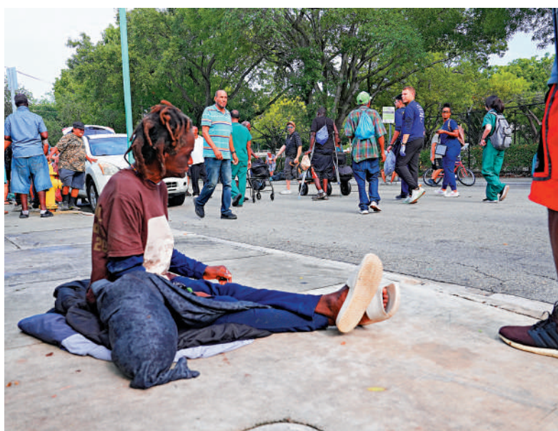
▲不少美國人生活貧困，超過70萬人淪為無家者。