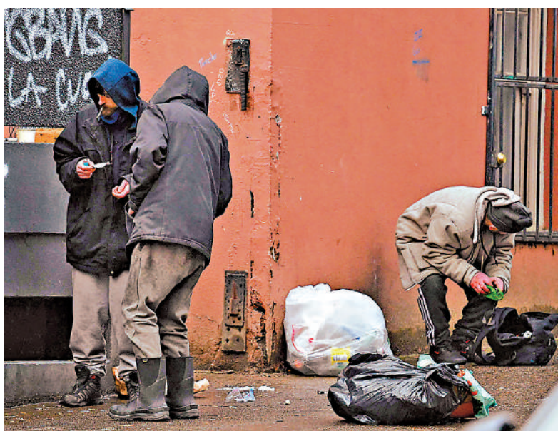
▲美國禁毒不力，境內逾10萬人因濫用藥物而死。