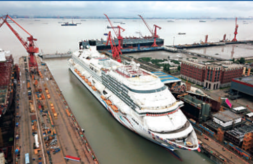
▲2023年6月6日,由中國船舶外高橋造船有限公司建造的首艘國產大型郵輪「愛達·魔都號」出塢。