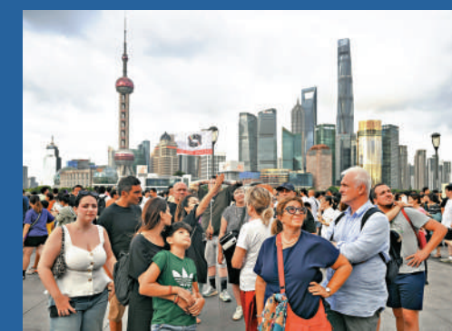
▲中國始終堅持對外開放,不斷擴大免簽「朋友圈」,催生「中國遊」火熱。圖為意大利遊客在上海外灘聽導遊介紹景點。