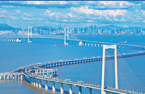
▲深中通道全長約24公里,集「橋、島、隧、水下互通」於一體,是世界上最難建設難度最高的跨海集群工程之一。