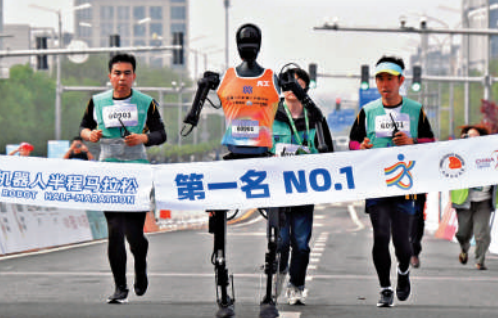
▲天工隊選手天工Ultra(左二)在2025北京亦莊半程馬拉松暨人形機器人半程馬拉松比賽中衝向終點。新華社