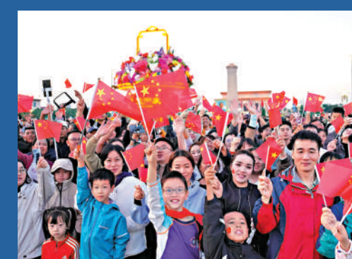
▲10月1日清晨,隆重的升國旗儀式在北京天安門廣場舉行,慶祝中華人民共和國成立76周年,觀眾在升旗儀式後歡呼。新華社