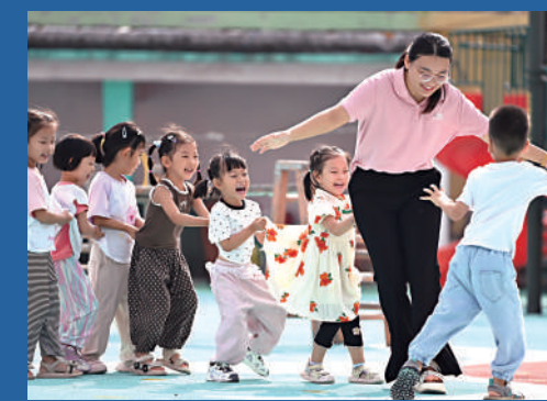
▲9月10日,在山東省滕州市西崗鎮中心幼兒園(紫里)分園,老師和小朋友一起玩「老鷹捉小雞」趣味遊戲。