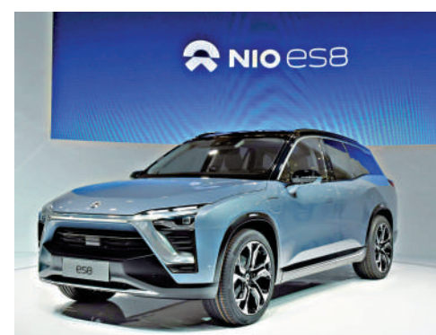
▲ 蔚來旗下新車型ES8的需求較原來預期的為好。

翻查蔚來今年第二季的業績顯示，銷售及管理費用為39.6億元（人民幣，下同），較首季度的44億元有所下降。但相關費用佔收入的比例仍然超過20%，同為這車新勢力的理想（02015），該比例僅為10%。