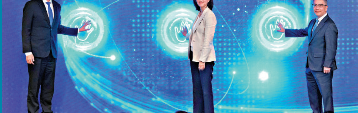
▲(左起)商務及經濟發展局副局長陳百里；香港銀行公會主席、渣打香港兼大中華及北亞區行政總裁謝惠儀；以及香港金管局副總裁阮國恒共同主持「中小企博覽：跨境視野論壇」開幕典禮。