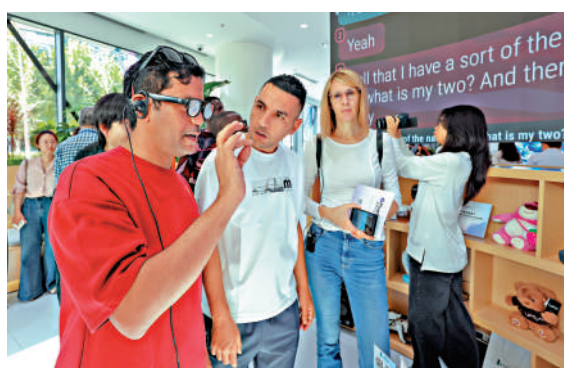
中國持續暢通對外開放通道。圖為今年9月，外國記者在北京體驗自動翻譯眼鏡。