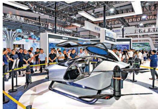
五年規劃通過確立發展目標引領發展方向。圖為今年9月，觀眾在重慶的智博會上參觀電動垂直起降飛行器。