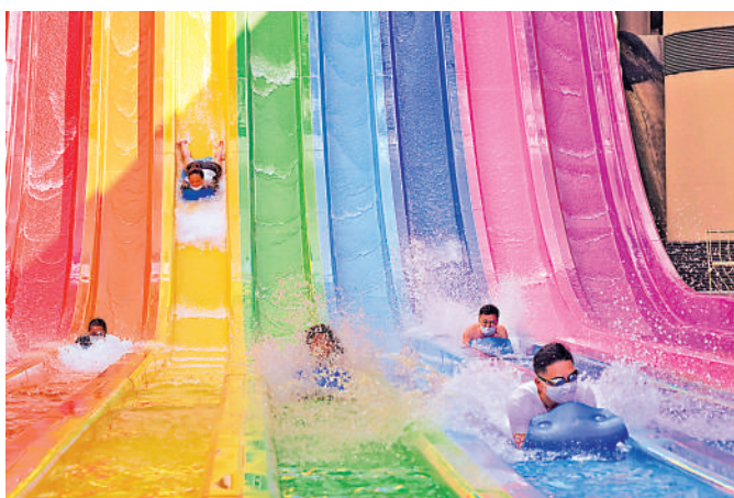
▲海洋公園水上樂園2024/25年度錄得近1.5億元經營虧損，拖累整體回報。