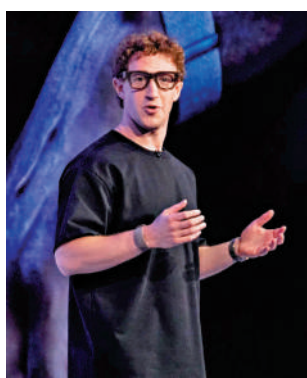
▲今年9月，Meta創辦人朱克伯格在Meta加州總部舉行的Meta Connect活動上發表演講。

自Meta今年6月宣布向Scale AI投資143億美元，並聘請汪滔加入Meta後，圖靈獎得主、Meta首席科學家楊立昆(Yann LeCun)負責的老牌實驗室FAIR便一直處於被邊緣化的狀態。今年7月，朱克伯格宣布成立一個名為「超級智能實驗室」(MSL)的全新實驗室，由汪滔擔任首席AI官。MSL整合了Meta內部多個團隊，包括FAIR。Meta還任命了從OpenAI挖角過來的研究員趙景佳擔任首席科學家。一位知情人士稱，楊立昆對於外界「他已被降職」的看法感到十分惱火，而65歲的楊立昆要向28歲的汪滔進行匯報的消息也一度引發爭議。8月，「超級智能實驗室」被拆分成4個小組，其中FAIR負責基礎AI研究，TBD Lab負責超級智能研發；其餘兩個負責產品開發和AI基礎設施建設。據知情人士爆料，TBD Lab中全是從OpenAI、谷歌等高薪挖角而來的研究員，這也導致了「新舊兩派」間的緊張關係，一些元老級研究員對新部門的