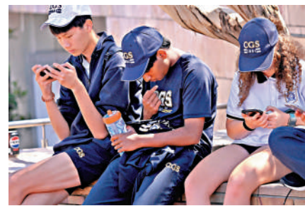
▲澳洲要求多家AI聊天機器人公司說明如何防止兒童接觸到危險內容。圖為墨爾本學生們正在看手機。

澳洲近年加強監管社交媒體，防止其對青少年兒童產生不良影響。自今年12月起，社交媒體公司必須停用或拒絕16歲以下用戶的賬戶，否則將面臨最高4950萬澳元(約合2.5億港元)罰款。