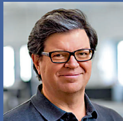
▲圖靈獎得主、Meta首席科學家楊立昆。

【大公報訊】據Meta發言人證實，裁員通知已於22日早上傳達給美國員工，預定於11月21日生效。Meta稱，這輪裁員主要影響Facebook人工智能研究(FAIR)部門，以及負責AI產品開發與基礎設施的團隊。《紐約時報》稱，Meta的「超級智能實驗室」目前約有超過3000名員工。負責操刀此次裁員的正是Scale AI創辦人、新任首席AI官汪滔(Alexandr Wang)。這波裁員不包括他直接領導、專門開發超級智能和大語言模型的新實驗室「TBD Lab」部門，可見朱克伯格更倚重高薪聘來的新團隊，而不是老員工。汪滔在內部信中表示，精簡後有助於加快決策、並擴大每個崗位的職責範圍和影響力。汪滔表示，受影響的員工將有機會「轉崗」到Meta內部其他崗位。