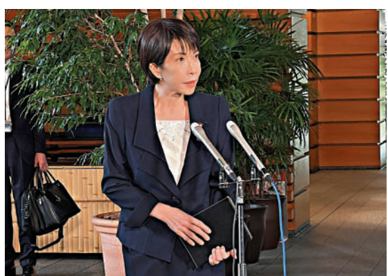
▲日本首相高市早苗22日在東京首相官邸回答記者提問。

另外，高市早苗將在24日發表首次施政演說。日媒曝光草案內容，包括計劃在2027年度進一步增加國防經費到佔GDP的2%。日本新任經濟安全保障擔當大臣小野田紀美，在上任後的首場記者會強調，將重新評估外國人相關制度。高市就任首相後，新設「與外國人有序共生社會推進擔當大臣」負責外國人政策，由小野田兼任。