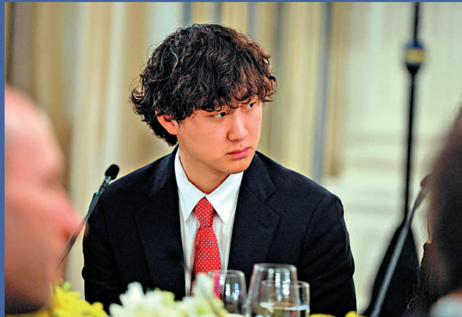
▲Scale AI創始人汪滔今年9月出席美國總統特朗普在白宮為科技和商業領袖舉辦的私人晚宴。

美國科技巨頭Meta22日證實，旗下「超級智能實驗室」(MSL)裁減約600人，以提升人工智能(AI)部門的靈活性與反應速度。今年6月以來，Meta的AI部門已經歷多次重組，該實驗室更是被整合又拆分。外界認為，Meta的開源AI模型Llama 4今年春天推出後反響不佳，創辦人朱克伯格對AI進展感到焦慮，但頻繁重組、裁減員工能否追趕其他科企巨頭的步伐仍要畫個問號。