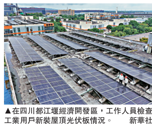
▲在四川都江堰經濟開發區，工作人員檢查工業用戶新裝屋頂光伏板情況。

促進城鄉融合發展，持續鞏固拓展脫貧攻堅成果，推動農村基本具備現代生活條件，加快建設農業強國。要提升農業綜合生產能力和質量效益，推進宜居宜業和美鄉村建設，提高強農惠農富農政策效能。