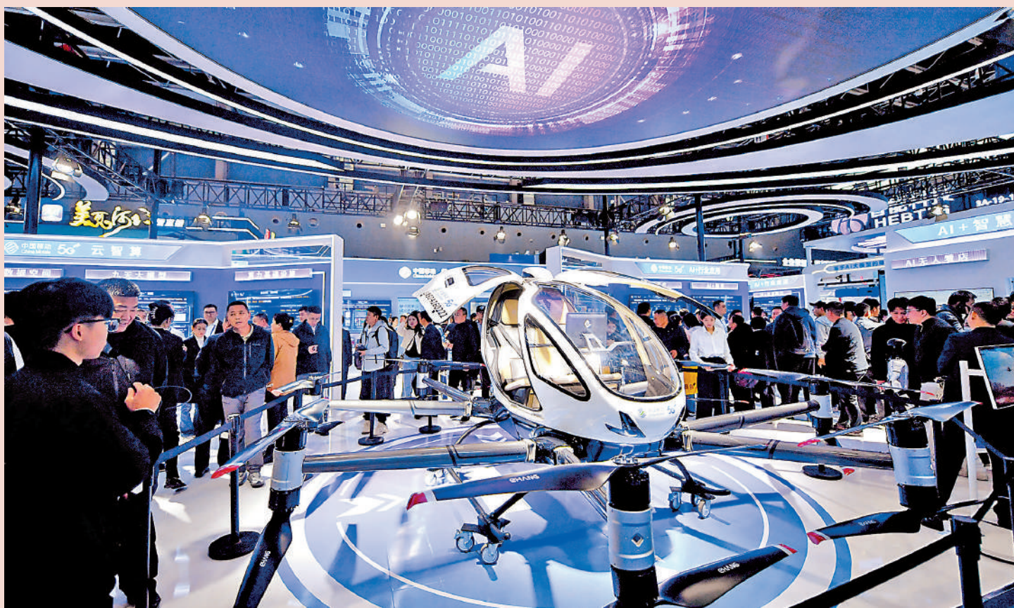
▲中共二十屆四中全會公報提出要培育壯大新興產業和未來產業。圖為10月17日，觀眾在2025中國國際數字經濟博覽會上了解可載人飛行器。