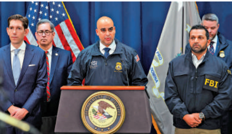
▲美國執法部門23日就案件召開記者會，圖中右前為美國聯邦調查局局長帕特爾。

另一項案件則涉及球員「打假球」和出售內部信息參與非法賭博，共6人被起訴，2023年至2024年共7場NBA比賽被做手脚。邁阿密熱火隊現役球員盧斯亞在2023年3月代表夏洛特黃蜂隊對陣新奧爾良鵜鶘