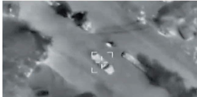
▲以軍公開空襲黎巴嫩真主黨南方陣線高級指揮官卡爾基的畫面。

另外，以軍23日襲擊貝卡谷地東部地區，造成兩人死亡。隨後又襲擊了黎巴嫩南部的阿爾薩利姆鎮，導致包括一名老婦在內的另外兩人喪生。