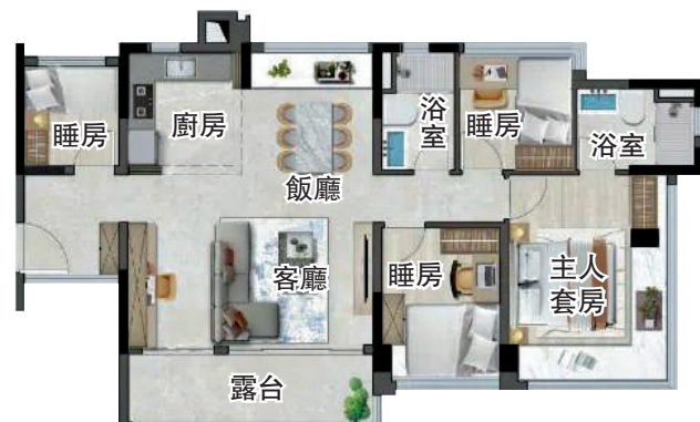
▲廣開·雲翰105平米四房兩廳戶型圖。