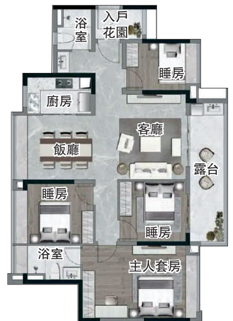
▲知識城·悅辰壹號位於中新知識城，以現樓交付。▲知識城·悅辰壹號128平米四房兩廳戶型圖。