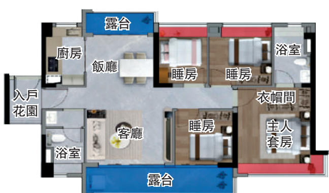
▲科城·新世代108平米四房兩廳戶型圖。