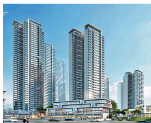
▲科城·新世代住宅建築面積33萬平米。

項目為大型綜合項目，住宅部分佔地5.3萬平米，建築面積33萬平米，共2106個單位。目前首推第2、4、5座，其中第2座是兩梯三戶，第4和5座是兩梯六戶，單位面積由67至119平米，間隔兩房至四房。90平米三房戶設U形廚房，三個房間均向南，空氣對流舒適。方正的108平米戶型，四房兩廳設