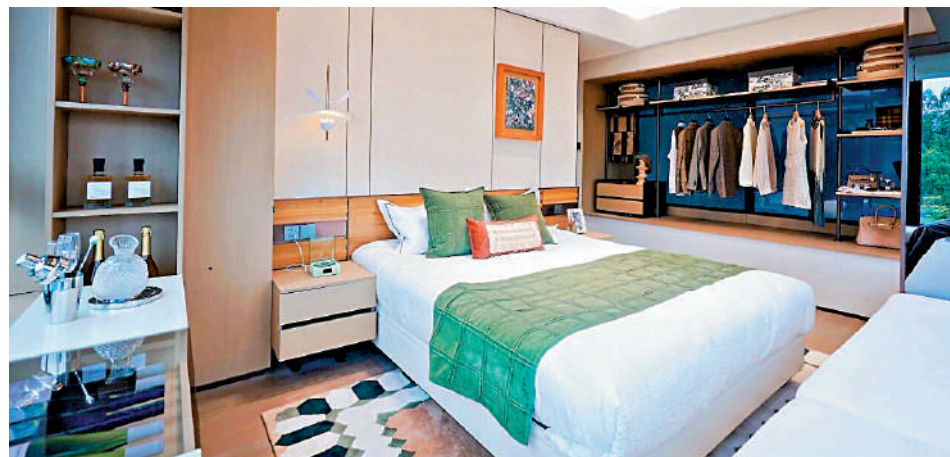
▲廣開·雲翰睡房面積寬敞舒適，可三邊採光。

視野開闊 位處中新知識城南起步區核心位置的廣開·雲翰，緊鄰華南師範大學附屬中學知識城校區。作為知識城片區首批新現住宅項目之一，廣開·雲翰以面積76至188平米的三房至五房戶型產品線，精準鎖定改善型家庭與精英客群的需求。