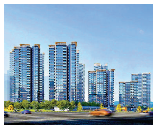
▲廣開·雲翰共5幢住宅，樓間距寬闊。

L形轉角窗台。105平米四房兩廳戶型，客飯廳廚廚一體化設計，南北對流，觀景露台闊5.6米，自在賞景。