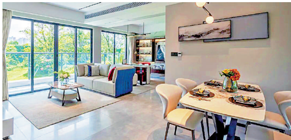
▲科城·新世代客廳外連露台，盡覽室內美景。

交通便利 在中新知識城板塊，緊鄰黃埔第一高樓「知識塔」的科城·新世代，同樣受到年輕客戶追捧。項目由黃埔區屬國企科學城集團打造，主打「地鐵+湖景+性價比」，總價約100萬元人民幣（約109萬港元）即可上車，吸引不少剛需客。