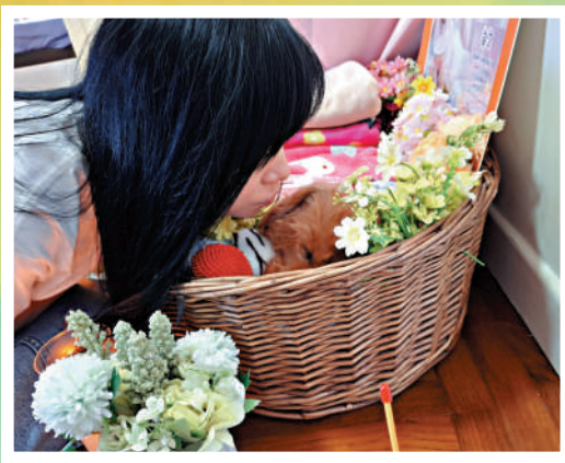
▲陳太太與愛犬道別，自言十分捨。