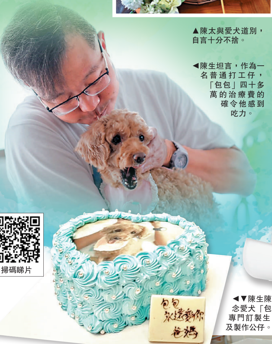
▲陳生陳太太為紀念愛犬「包包」，專門訂製生日蛋糕及製作公仔。