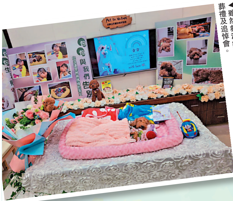
▲雖然救治無效，陳生陳太太亦專程為「包包」舉辦葬禮及追悼會。