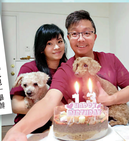
▲陳生陳太太將愛犬當成家人，親密無間。