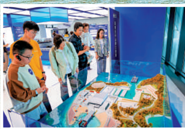
▲遊客在深中通道西人工島上的粵港澳大灣區跨海通道科普基地內參觀。

●灣區通道發展史、十大世界之最成果，了解工程建設攻克的九大世界級難題 ●VR互動裝置、海底隧道「呼吸系統」模型，遊戲化體驗交通工程原理，適合親子研學