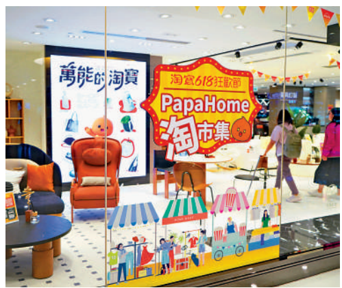
港商可加強人力和財力，全心投入發展內銷市場。

內銷，卻不肯花錢請專人負責，只由香港員工兼任，可是很多香港人對內地消費文化和品味仍是一知半解，這樣根本做不出成績來。所以不可一味要求特區政府提供支持，港商要發奮圖強，積極進入內地市場。」商會人士批評，不少港商空有做內銷的雄心，卻不能用心去做，當然事倍功半。