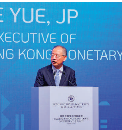
圖為余偉文去年在國際金融領袖投資峰會的主峰會上致辭。