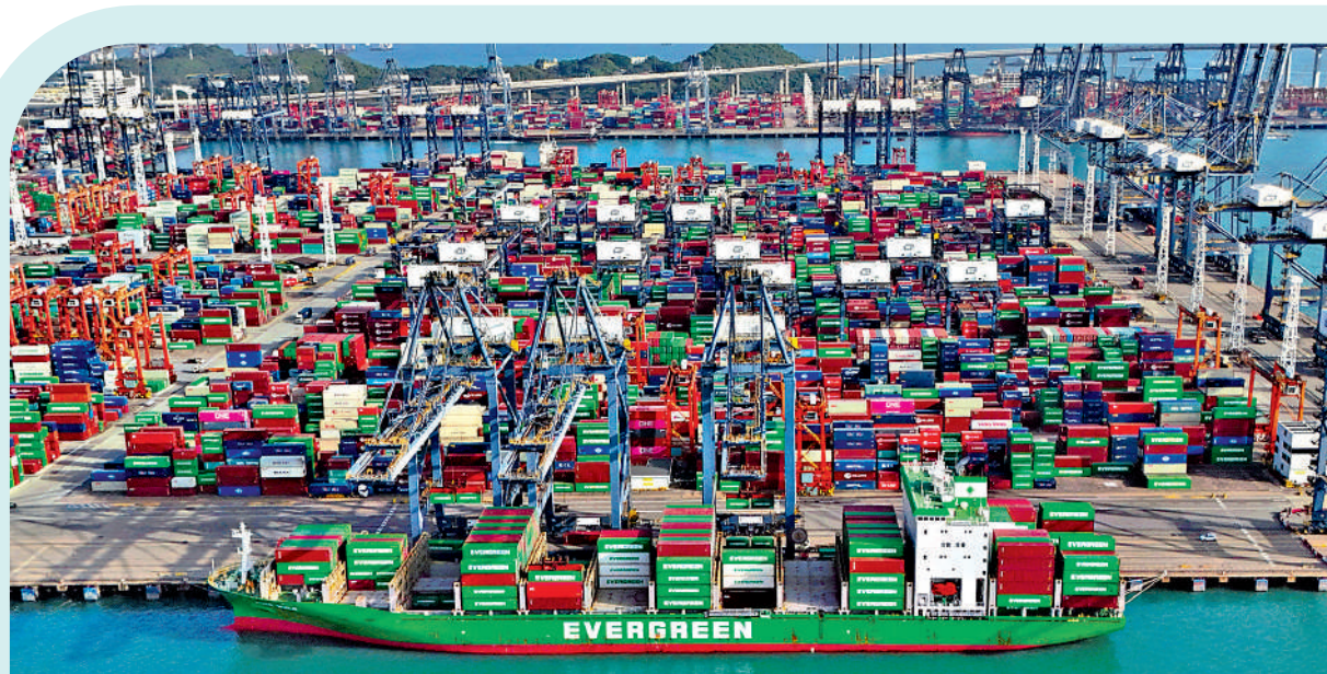
香港9月出口升16.1%勝預期，輸往內地出口按年升幅擴大8.5個百分點至16.7%。

資料顯示，上月與去年同期比較，輸往亞洲的整體出口貨值上升18.3%。此地區內，輸往大部分主要目的地的整體出口貨值錄得升幅，尤其是越南升50.9%、馬來西亞升40%、中國台灣升31.9%、印度升19.5%和中國內地升16.7%。除亞洲的目的地外，輸往其他地區的部分主要目的地的整體出口貨值錄得升幅，尤其是瑞士升138.5%和德國升27.6%，而作為香港第二大出口地的美國，則升4.8%。