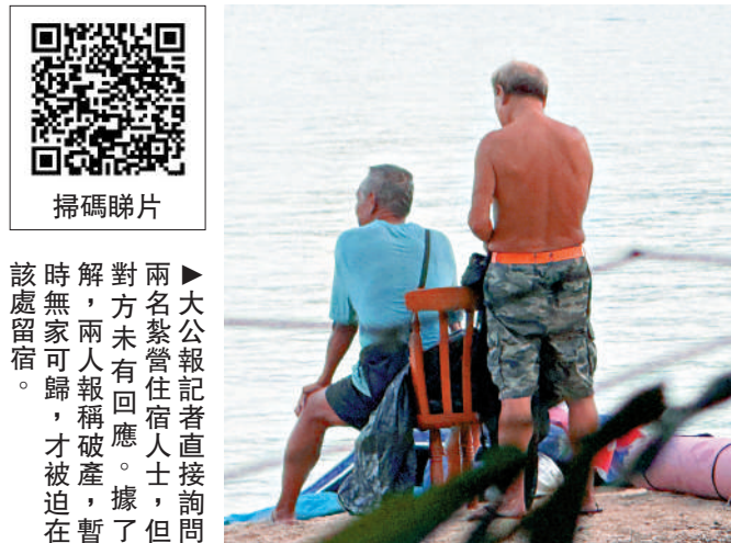
該處無家可歸。對兩名露宿者，兩名記者直接詢問，兩人未有回應。記者稱，兩名露宿者表示，他們在該處紮營已有一年多，但未有回應。記者稱，兩名露宿者表示，他們在該處紮營已有一年多，但未有回應。