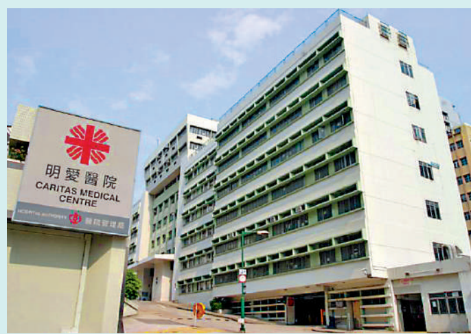
▲▲2020年初明愛醫院及羅湖港鐵站發生爆炸案，警方調查後拘捕8名涉案男女，他們另涉密謀同年3月在將軍澳尚德停車場外放置重約20公斤、外觀偽裝成墓碑的炸彈。

陳官判刑時表示，「串謀導致相當可能會危害生命或財產的爆炸」罪最高刑期為監禁20年。本案案情嚴重，三名被告行為如同「向社會宣戰」，三人長時間犯案，先後犯下明愛醫院爆炸案及羅湖站爆炸案，再計劃在將軍澳尚德停車場放置裝有20公斤「閃粉」的炸彈，其犯罪行為可謂「食髓知味、變本加厲」。