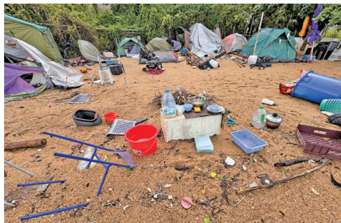
▲大公報記者發現屯門蝴蝶灣泳灘有露宿者長期紮營住宿，現場滿布垃圾。