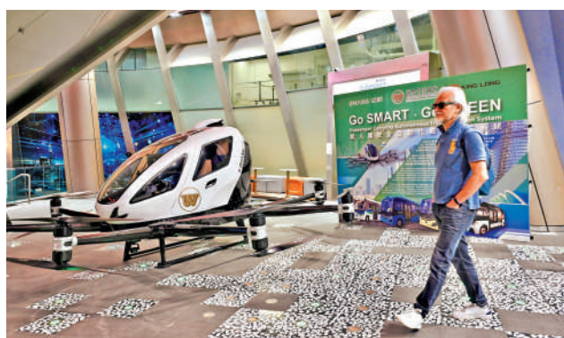
▲通訊局昨日推出無人駕駛飛機系統（專用）牌照，以支持低空經濟發展。圖為在數碼港早前低空經濟展覽中展示的電動垂直起降航空器。

通訊局表示，無人機（專用）牌照現開放予低空經濟「監管沙盒」試點項目的參與機構申請。有興趣的申請者可向通訊局提交申請及相關資料，包括所操作的無人機系統資料、民航處就特定飛行路徑的批准及預計需要建設的無線電基站詳情等。通訊局將根據申請人提交的資料嚴格審批申請，並密切監察無人機專用頻譜的使用是否符合牌照條件，確保頻譜資源有效運用。